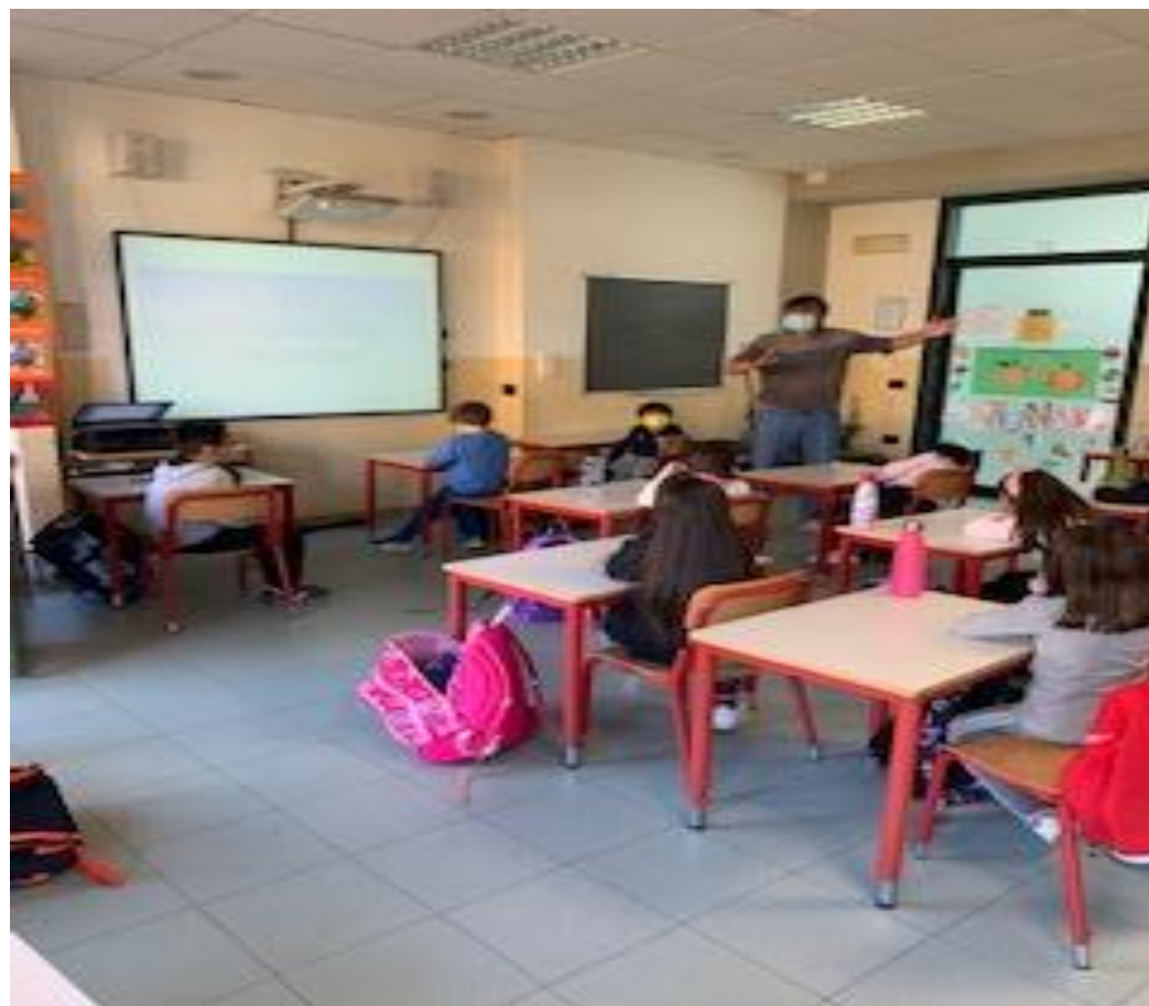
GLI ALUNNI DI 2F