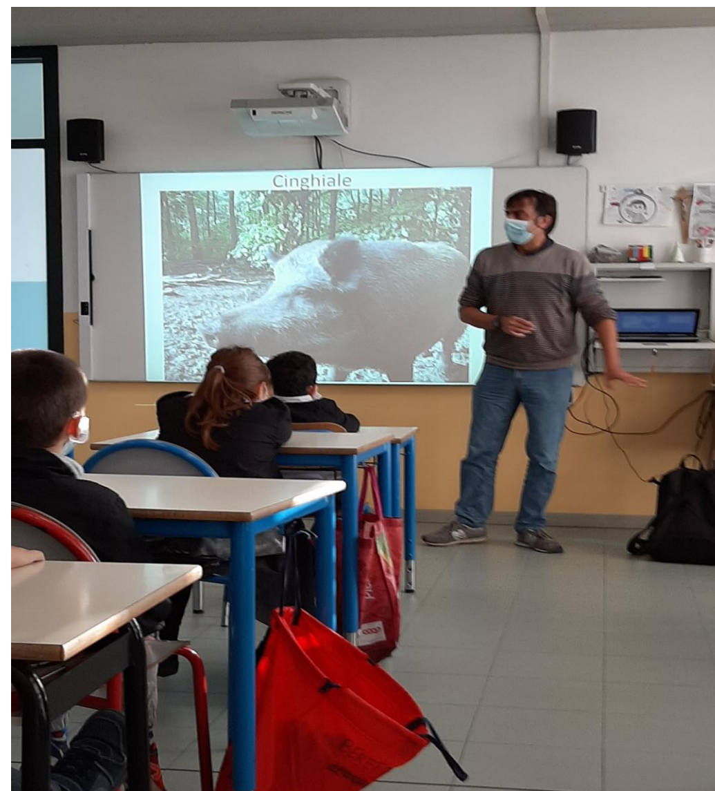
GLI ALUNNI DELLA CLASSE 2 E