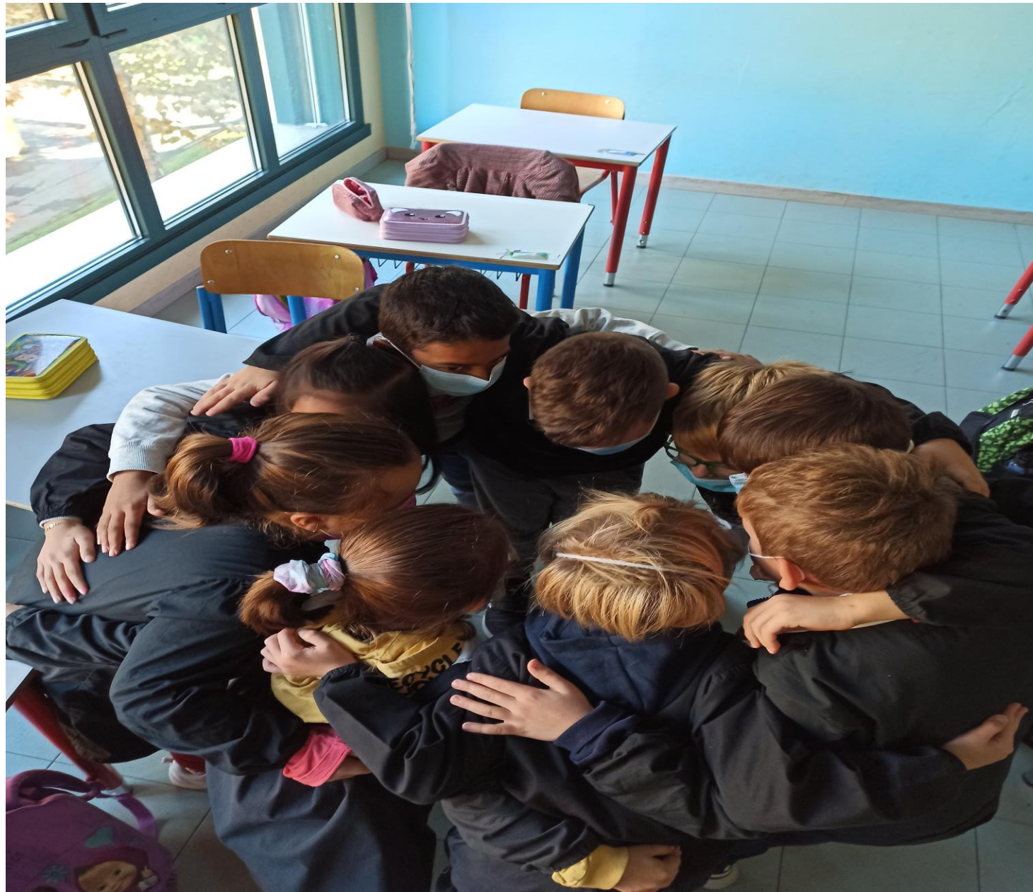
GLI ALUNNI DELLA CLASSE 2 G